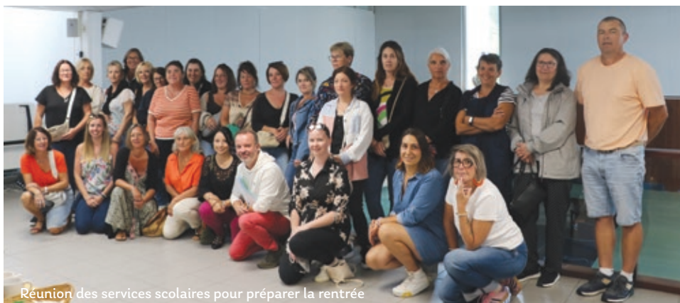
Réunion des services scolaires pour préparer la rentrée