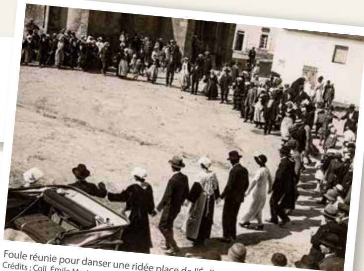
Foule réunie pour danser une ridée place de l'Église.