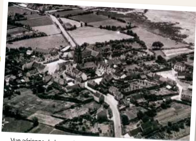
Vue aérienne du bourg dans les années 1930-1940.

Cette route était déjà un axe majeur à l'époque gallo-romaine. Elle reliait Vannes, alors dénommée Darioitum et fondée à la fin du I er siècle av. J.-C., à Nantes. En 2019, des fouilles archéologiques ont mis au jour à Bezidel la présence d'un établissement rural d'importance à cette époque, à proximité de cette voie très empruntée.