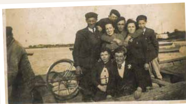
Sinagots se rendant à Saint-Armel avec le passeur dans les années 1950.

Après la naissance de la société des courses de Vannes en 1842, un hippodrome est créé sur la lande de Cano, sur l'axe reliant Saint-Laurent au bourg. L'actuelle route de l'hippodrome et la rue Cousteau sont quant à elles construites bien plus tard pour desservir le collège Cousteau créé en 1987. Bien qu'inutilisée aujourd'hui, l'ancienne route demeure visible au milieu du champ de courses.