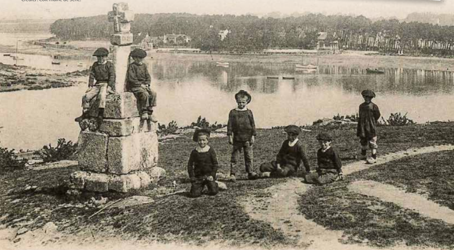
Enfants posant devant la croix de Barrac'h.