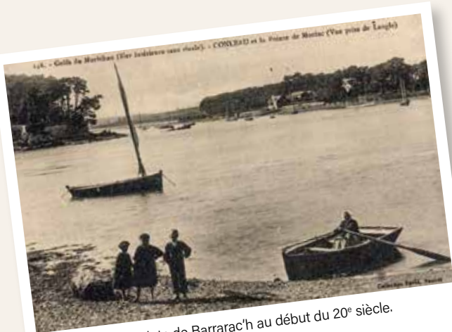
Passeuse à la pointe de Barrarac'h au début du 20 e siècle.