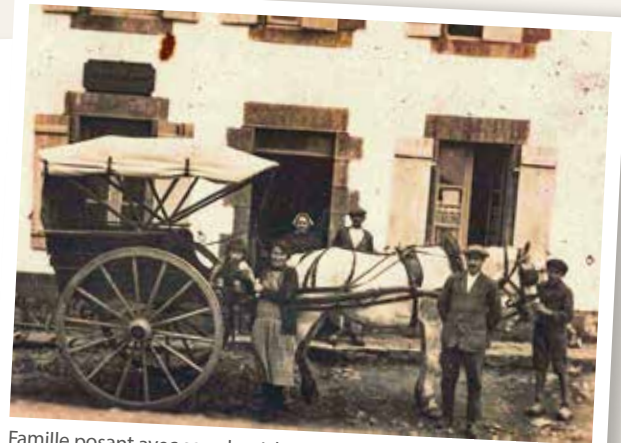
Famille posant avec son char à bancs devant la boulangerie du bourg en 1927.