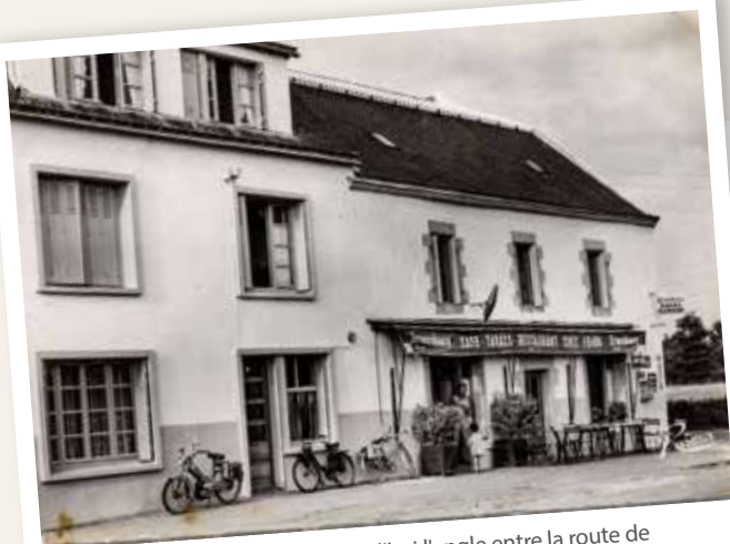
Le café Penru, au Pouffanc (aujourd'hui l'angle entre la route de Nantes et la rue du Versa.