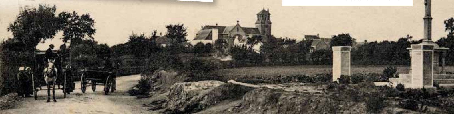
L'actuelle rue des Écoles au début du 20 e siècle.

Le dernier passeur à la rame cesse son activité en 1963. Le passage est relancé à la fin des années 1990 et le Petit Passeur est aujourd'hui un service de Golfe du Morbihan-Vannes agglomération.