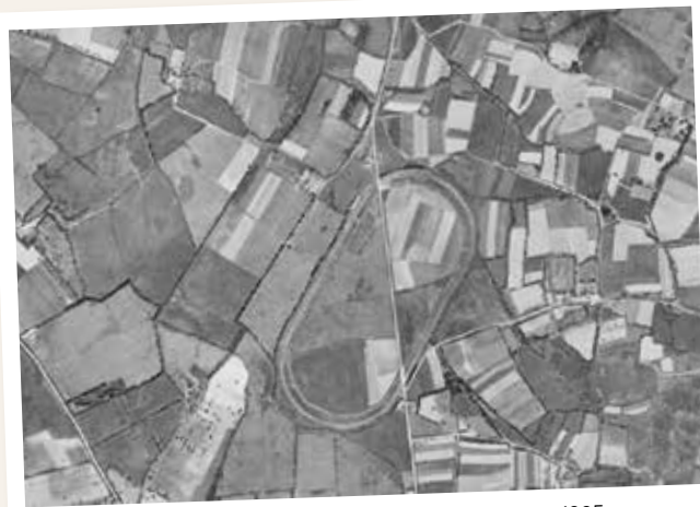
Vue aérienne de l'hippodrome dans les années 1950-1965.