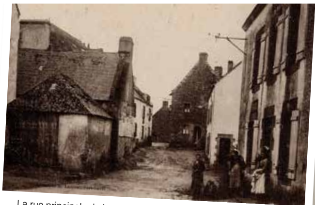
La rue principale du bourg avec l'immeuble Simon en 1926.

Jusqu'en 1930, date de sa démolition, un bâtiment appelé immeuble Simon se trouvait au beau milieu de l'actuelle rue de Bel-Air. Il cachait l'hôtel de ville et l'ancienne école et réduisait considérablement le passage vers Cantizac et Vannes.