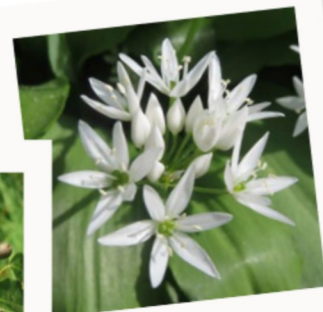
AIL SAUVAGE, AIL DES OURS ( Allium ursinum )