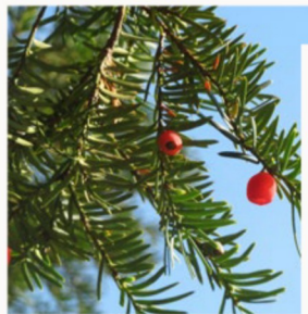
IF COMMUN ( Taxus baccata )