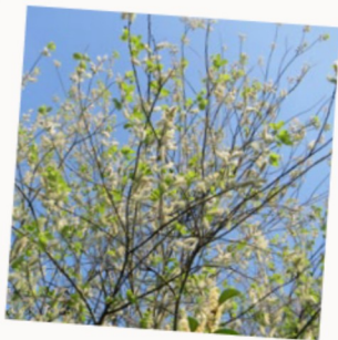
SAULE MARSAULT ( Salix caprea )