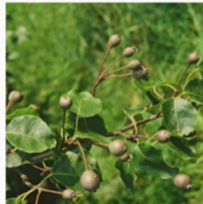
POIRIER À FEUILLES EN CŒUR ( Pyrus cordata )